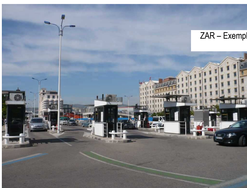
ZAR – Exemple de poste d'inspection filtrage

Taux : Contrôles effectués systématiquement lorsqu'un doute naît lors des contrôles d'inspection filtrage de la catégorie précédente et en cas de déclenchement de l'alarme d'un détecteur, mais aussi de manière aléatoire et continue à des taux plus faibles que les précédents.