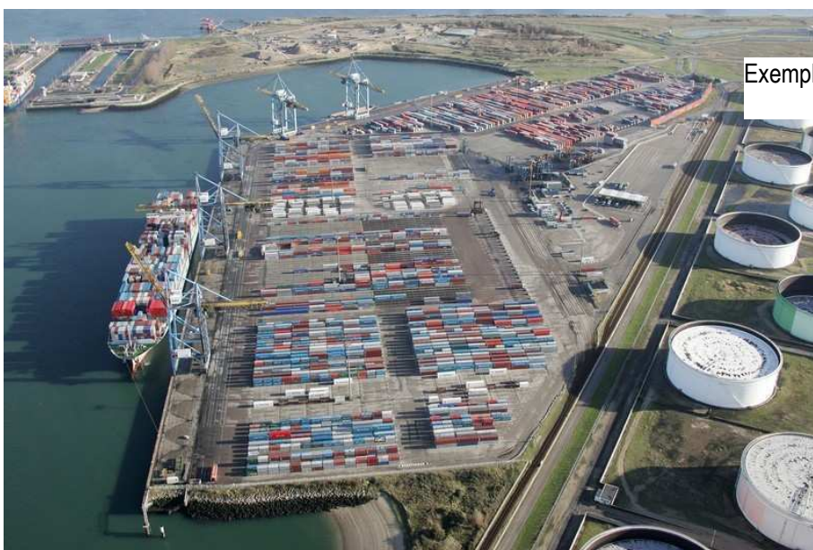
Exemple d'installations portuaires - Containers

Des ZAR portuaires (en dehors de toute installation portuaire) peuvent aussi être créées, au cas par cas. Contrairement aux installations portuaires, les ZAR portuaires ne sont pas définies à priori en fonction de la nature des trafics ; dans les faits, l'évaluation de sûreté portuaire est l'outil d'analyse privilégié pour décider de la pertinence d'une ZAR portuaire.