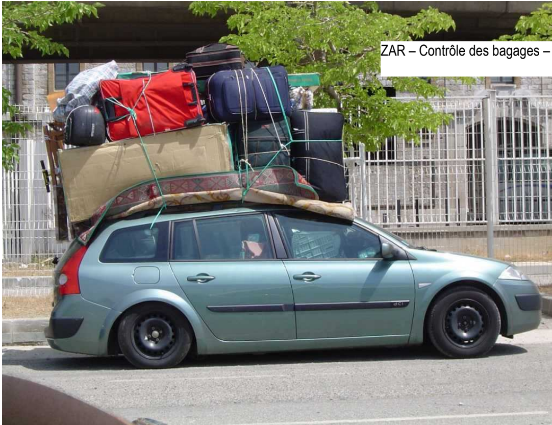
ZAR – Contrôle des bagages – Cas particulier

d'agrément, les besoins en formation. Enfin, les consignes opérationnelles destinées aux personnes chargées des visites de sûreté font l'objet d'une diffusion particulière et sont regroupées dans un volume particulier du plan.